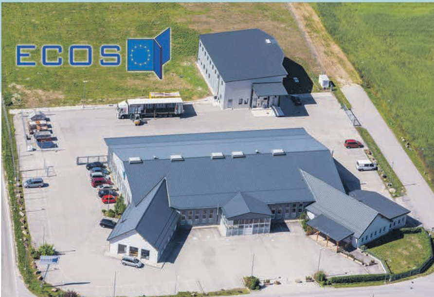
Fa. Ecos Kirchberg am Wagram.