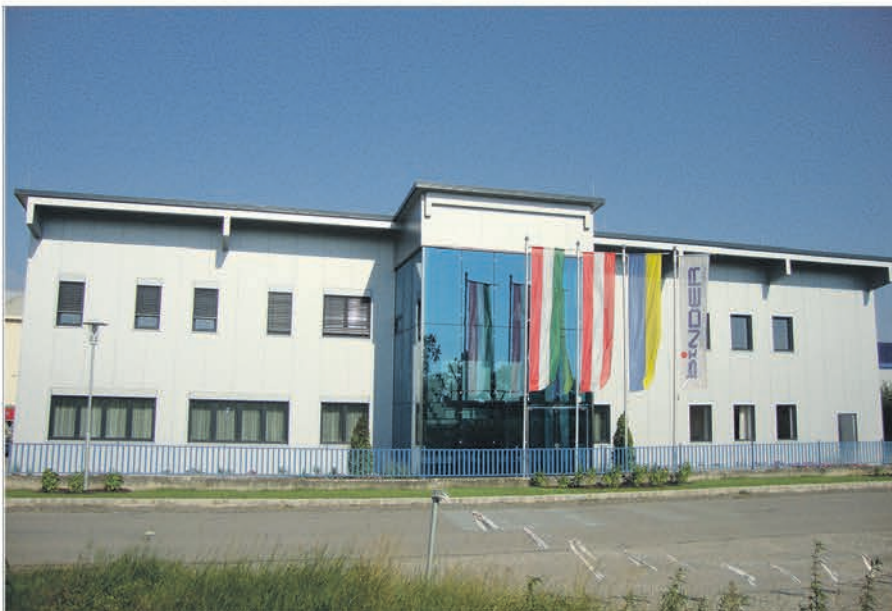
Standort Zwentendorf an der Donau.