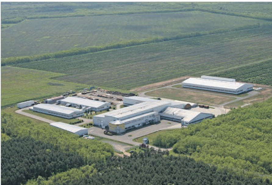
Standort Csöngye in Ungarn.