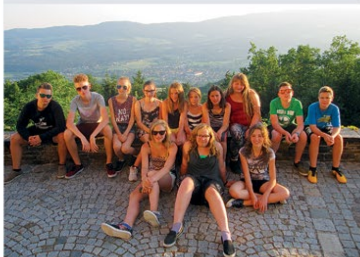
Kultur: Nach der Kirchenbesichtigung am Pöllauberg beim Trainingslager