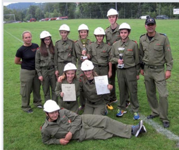
Feuerwehrjugend 2 mit 2 Pokalen in Schöffern