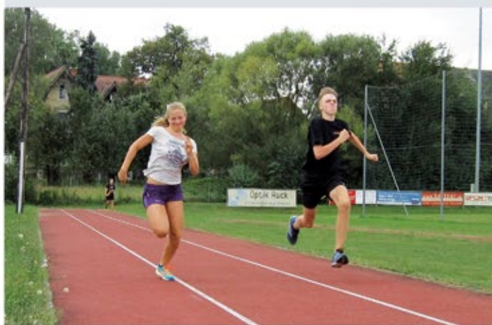
60m Sprint für das ÖSTA-J beim Sporttag