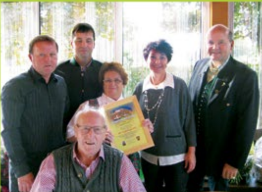
Stoff Rudolfine, Pichla 40a - 80. Geburtstag