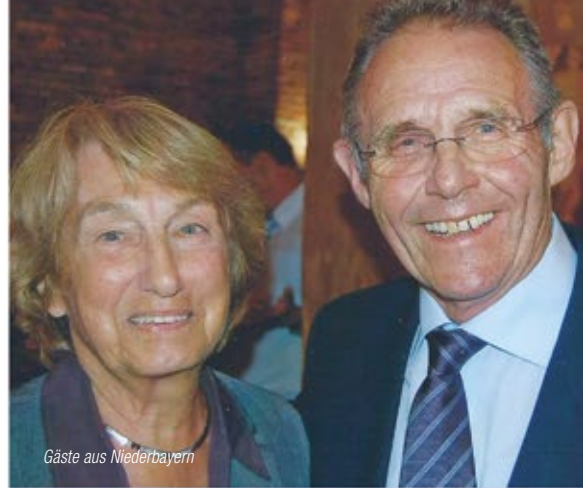
Gäste aus Niederbayern