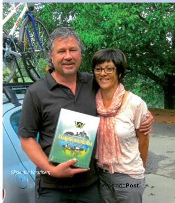
Gäste aus Vorarlberg

Die Gemeinde Kapfenstein dankt beiden Familien für die langjährige Treue und wünscht viel Freude mit der Chronik von Kapfenstein.