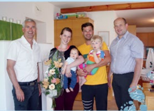
Storm Neo, Neustift 70