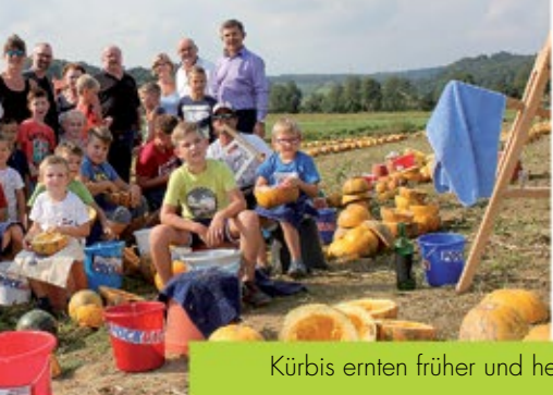
Kürbis ernten früher und heute