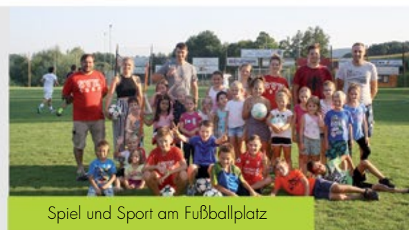
Spiel und Sport am Fußballplatz