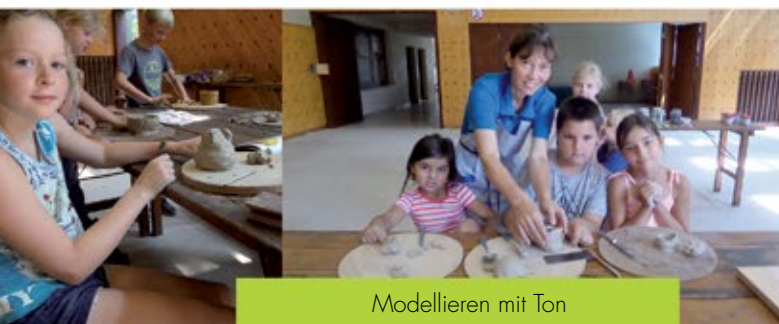
Modellieren mit Ton