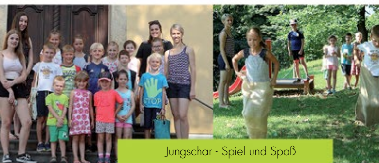
Jungschar - Spiel und Spaß