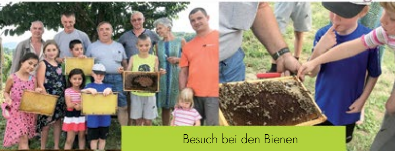
Besuch bei den Bienen