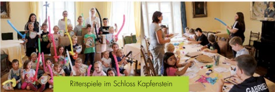
Ritterspiele im Schloss Kapfenstein