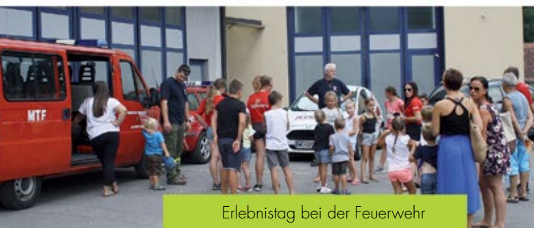
Erlebnistag bei der Feuerwehr