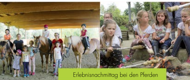
Erlebnismittag bei den Pferden