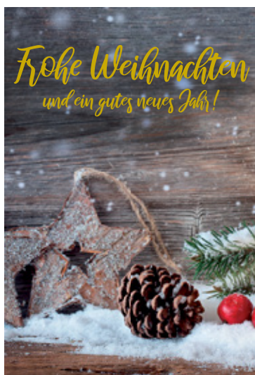
Die Versicherung auf Ihrer Seite.

Bis heute wurden 315 Fischereien MSC-zertifiziert, weitere 86 befinden sich im Zertifizierungsprozess. Dazu zählen kleine regionale Fischereien, wie auf die karibische Languste und schwedischen Zander, sowie große Fischereien wie z.B. die Fischerei auf pazifischen Bonito und Alaska-Seelachs.