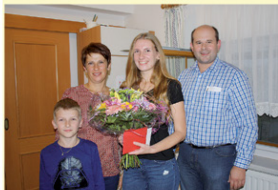
Groß Kathrin, Pichla 1