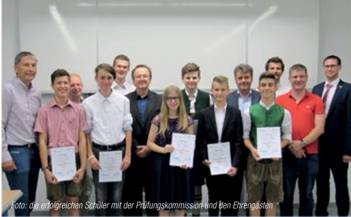
Foto: die erfolgreichen Schüler mit der Prüfungskommission und den Ehrengästen