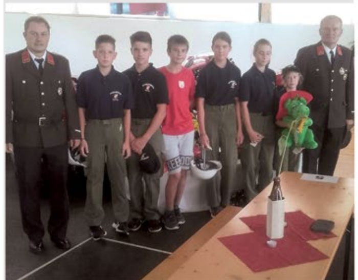
HBI List und OBI Lamprecht sind stolz auf ihre Jugend!