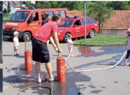
Erlebnistag bei der Feuerwehr