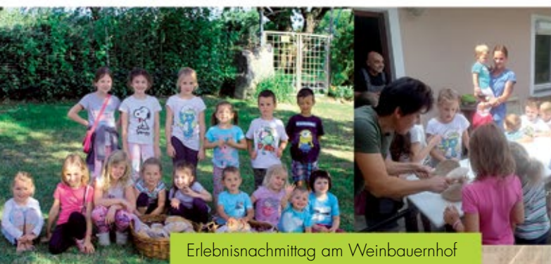
Erlebnismittag am Weinbauernhof