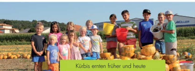
Kürbis ernten früher und heute