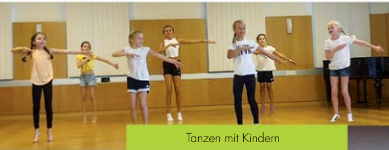
Tanzen mit Kindern