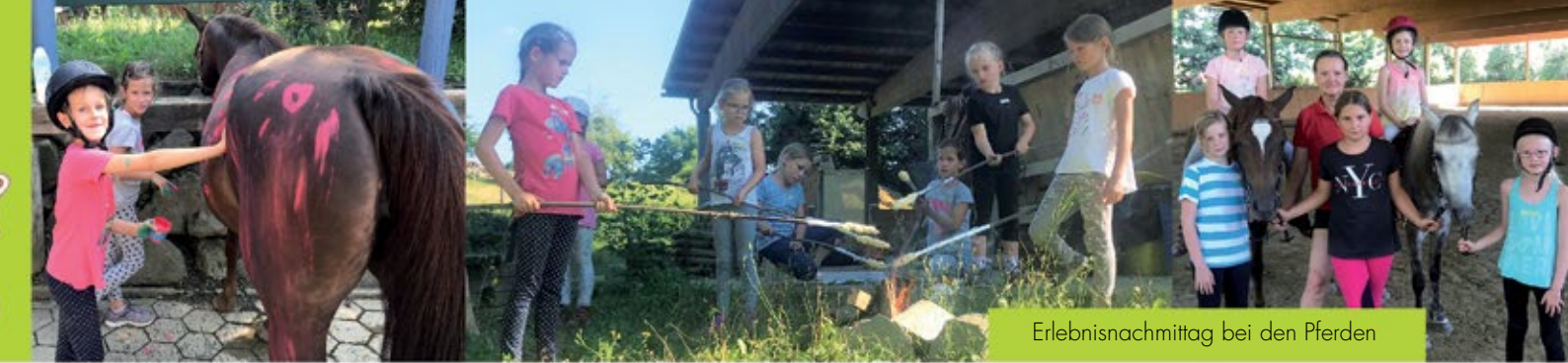
Erlebnismittag bei den Pferden