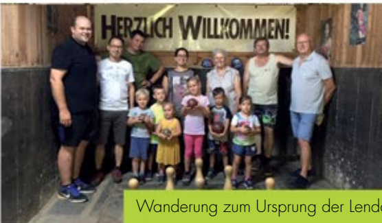
Wanderung zum Ursprung der Lendava