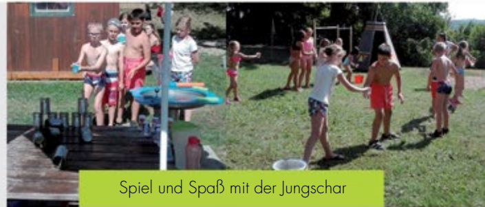
Spiel und Spaß mit der Jungschar