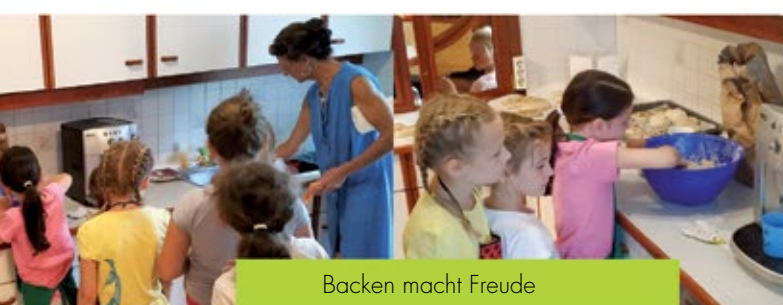
Backen macht Freude

Unter dem Motto „ Entdecke deine Heimat “ ist der heurige Ferien(s)pass erfolgreich zu Ende gegangen. In den Sommerferien von Juli bis September 2019 fanden 20 organisierte Ferienprogramme mit rund 200 TeilnehmerInnen statt. Spannende Erlebnisse für Kinder von 4 bis 16 Jahren. Zusätzlich gab es heuer einen speziellen Fokus auf das „Handwerk in unserer Region“. Zum Thema: „Wir bauen ein Haus“ wurden noch zusätzlich 7 Veranstaltungen in der Region angeboten.