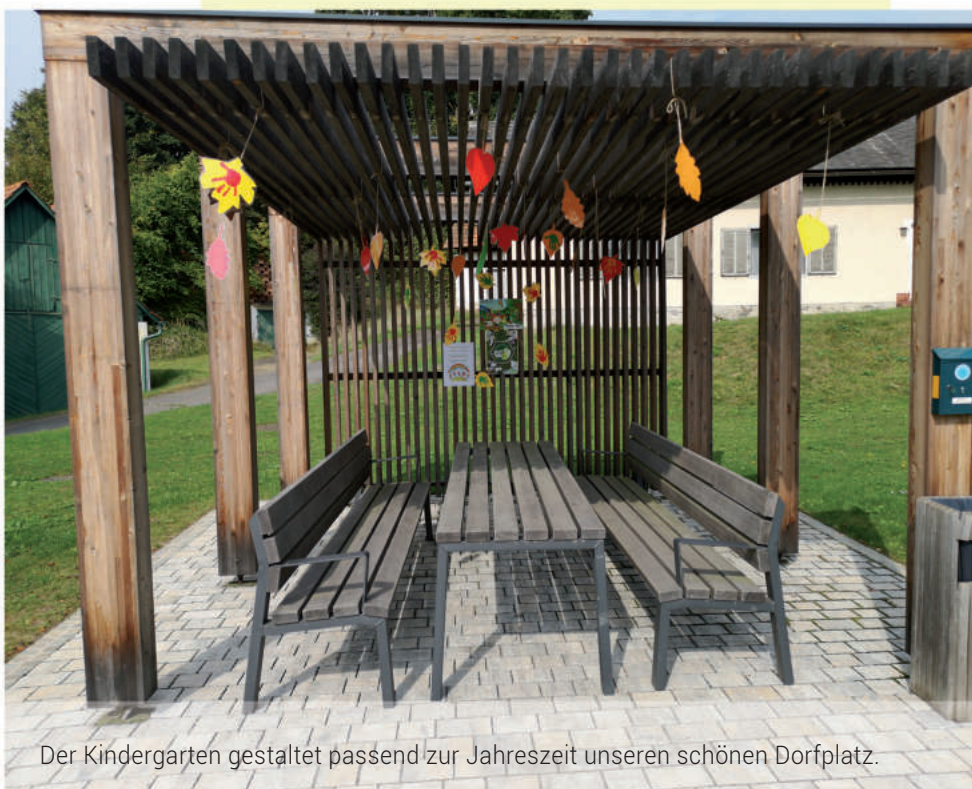
Der Kindergarten gestaltet passend zur Jahreszeit unseren schönen Dorfplatz.