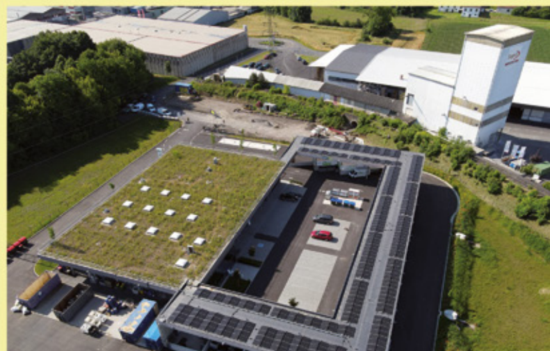
Beispiel Gründach mit Wasserrückhaltefunktion beim Ressourcenpark in Feldbach

Nähere Infos unter www.win.steiermark.at .