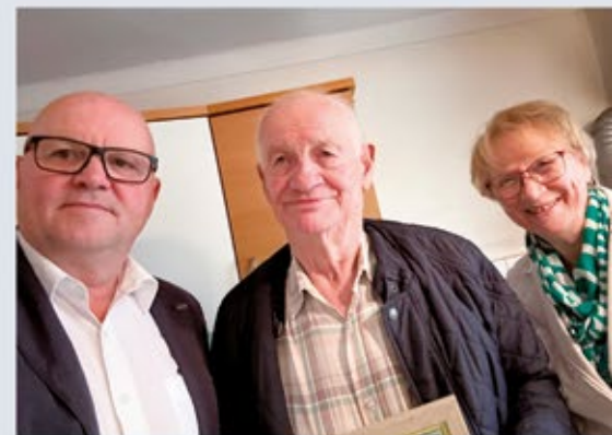
Pirs August, Pretal 116 - 85. Geburtstag